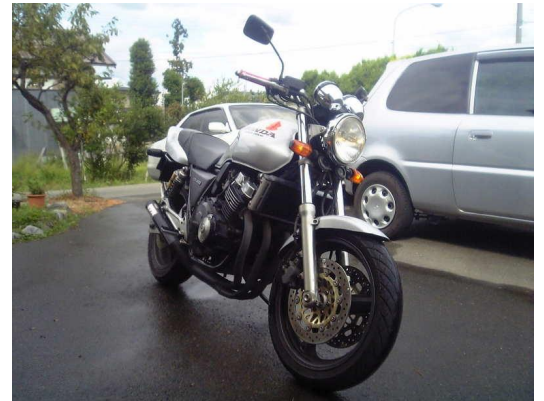
CB400 SUPER FOUR（実家にて）

1年ほど乗ってBIG1に乗り換えたのですが、買い換えるときに3万円位で下取りしたのに、数ヶ月後23万円で売られていたのを見て、悲しくなったことを思い出す。